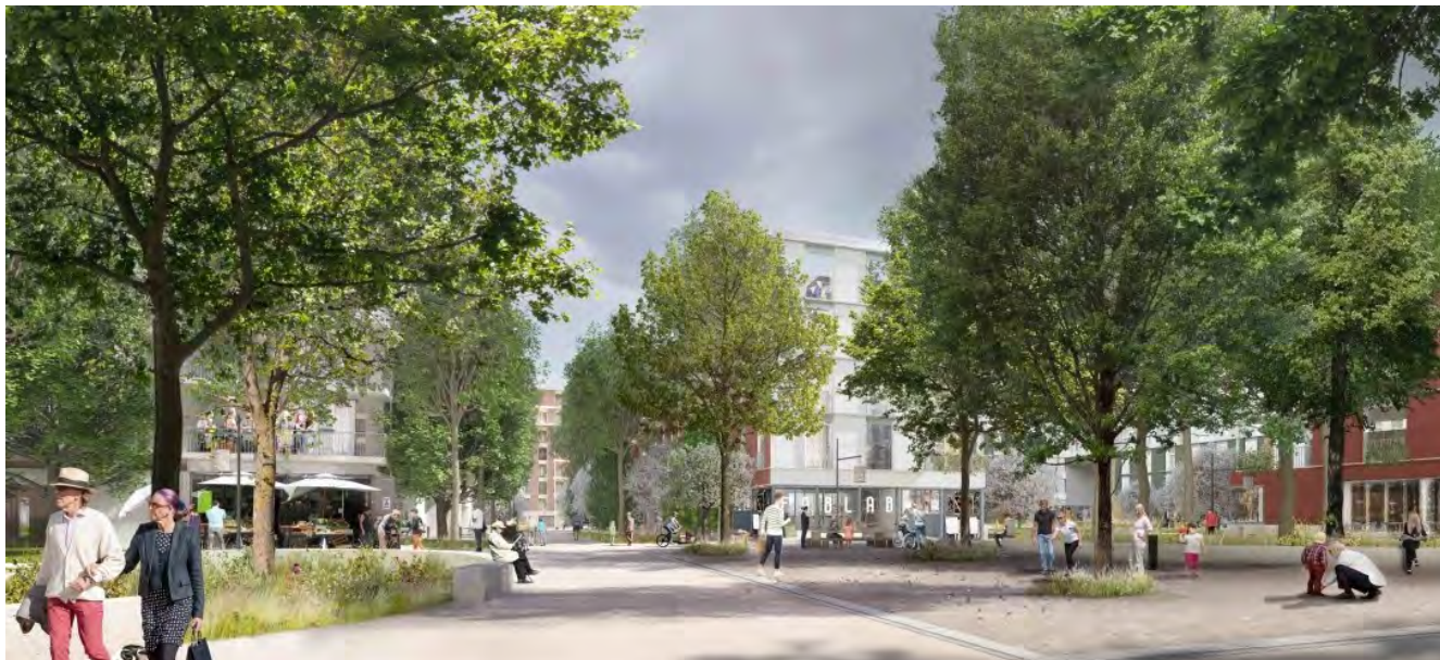
Image de synthèse du quartier du Rolliet.

Grand Projet des Cherpines Commune de Plan-les-Ouates Quartier du Rolliet, bâtiment E