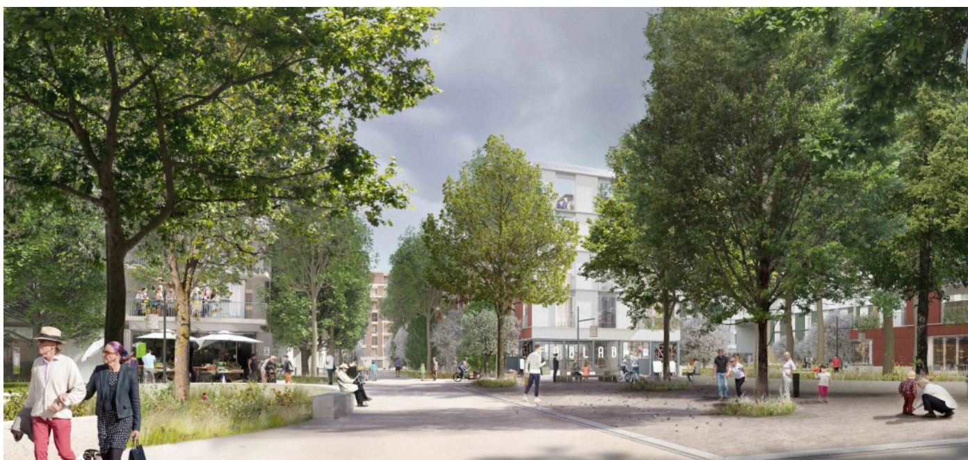
Image de synthèse du quartier du Rolliet

Pour l'attribution de l'arcade Services personnels